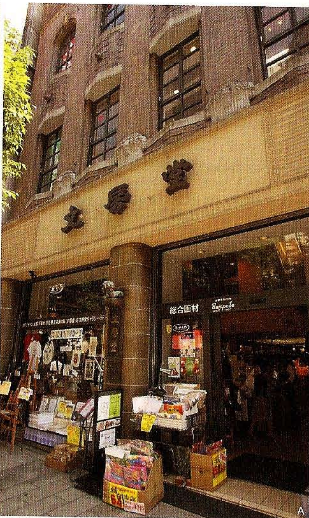
A—「千代田区景観まちづくり重要物件」に指定される店構え B—1912(大正10)年、日本で初めて製造販売した油絵具 C—5mlのミニサイズから170mlの大作用サイズまでそろう D—サムホールサイズの由来は、このスケッチ用油絵セットから来ている